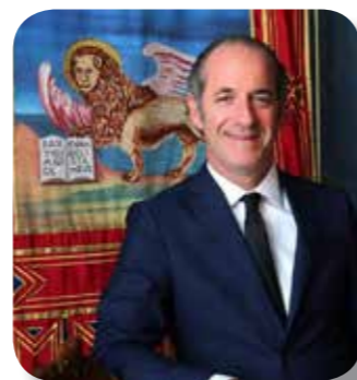
Luca Zaia Presidente della Regione del Veneto

Nel ringraziare tutta la compagine organizzativa per l'impegno profuso, concludo nel porgere i miei saluti, e un caloroso benvenuto a tutti i partecipanti: sono certo i Veneti non mancheranno di mostrare tutta la loro calorosa e proverbiale ospitalità.